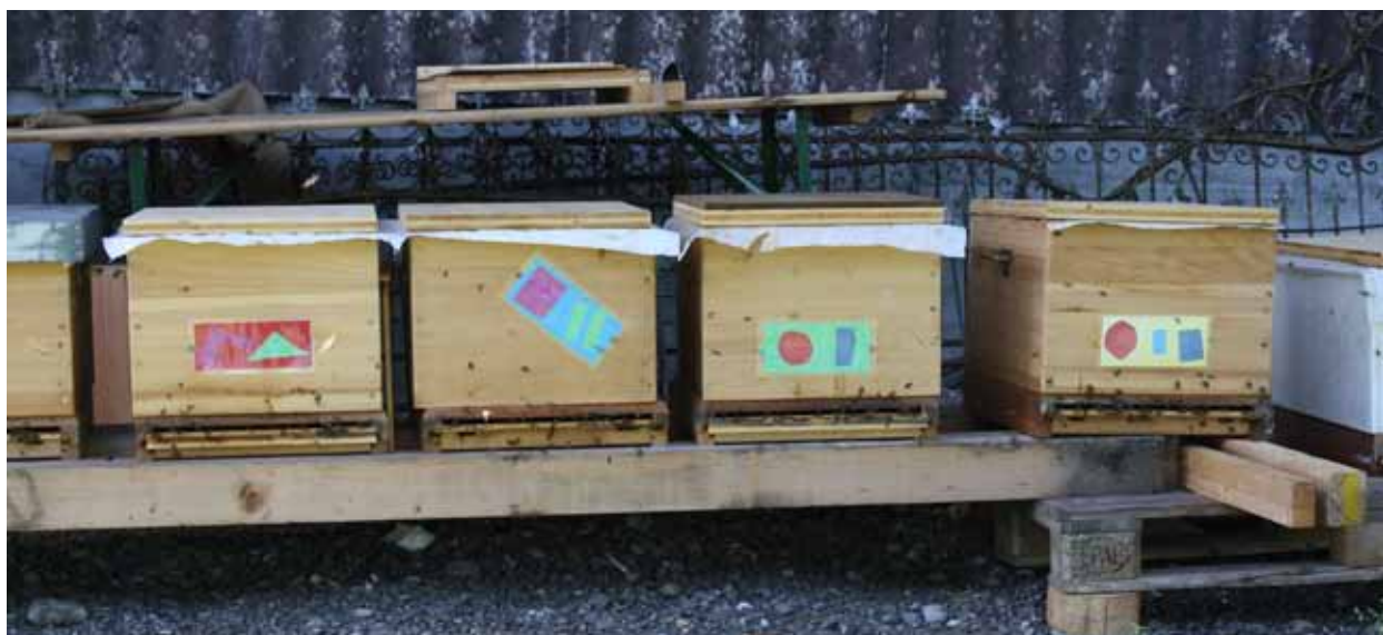
Magazine ganz in der Nähe im Schatten.