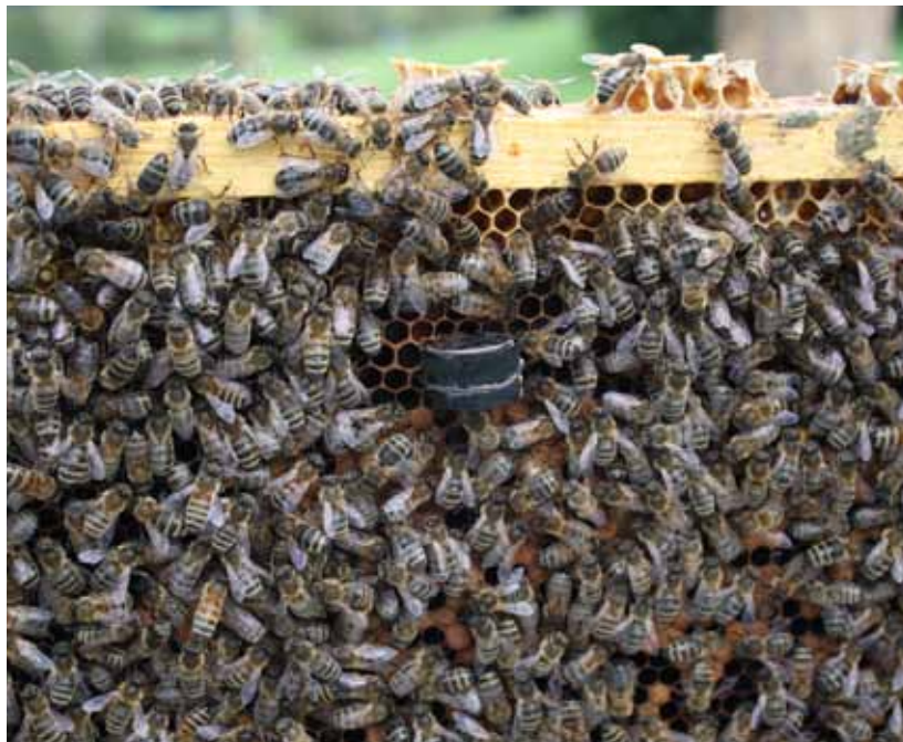
Messesensor auf der Bienenwabe.

Versuchsgruppen kein Unterschied auf die Entwicklung der Varroapopulation festzustellen war. Allerdings zeigt die Varroapopulation über alle Versuchsgruppen eine grosse Variabilität, welche sich nicht durch die Temperaturunterschiede zwischen den Völkern erklären lässt (Grafik 1). Damit erscheint es als unwahrscheinlich, dass die Aussentemperatur einen Einfluss auf die Entwicklung der Milbenpopulation hat.