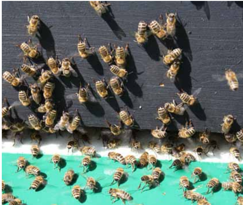
Temperaturregulation der Bienen beim Flugloch.

Die Bienenvölker in der Sonne hielten trotz der erheblichen Wärmeexposition durch die Sonneneinstrahlung auf die schwarzen Kästen die Temperatur im Bienenvolk weitgehend konstant. Die Temperatur wurde nur kurzzeitig erhöht, danach wieder ausgeglichen. Dies stellt eine enorme regulatorische Leistung des Bienenvolks dar und ist mit ein Grund für die Verbreitung der Honigbienen in stark unterschiedlichen Klimazonen. Ein Unterschied zu den Völkern im Schatten bezüglich der Temperatur im Brutnest konnte nicht festgestellt werden. Daher ist es auch nicht erstaunlich, dass in den beiden