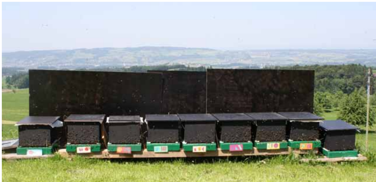
Schwarz bemalte Magazine am Sonnenstandort.

Ob und in welchem Ausmass Temperatur und Luftfeuchtigkeit im Bienenvolk durch Klima sowie durch vom Imker beeinflussbare Faktoren wie Standort und Bauart des Bienenkastens